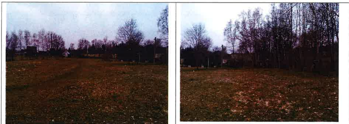
Plangebiet mit Flurstück 2249/9 Blick von Norden in Richtung Freiburger Straße

Das Plangebiet stellt neben einer Waldfläche eine intensiv genutzte Grünlandfläche dar, die sich südlich an den Siedlungsbereich „Am Hummelberg“ in Adorf unmittelbar anschließt ( Abbildung 4 ). Im Plangebiet ist eine Bebauung von zehn Eigenheimen vorgesehen.