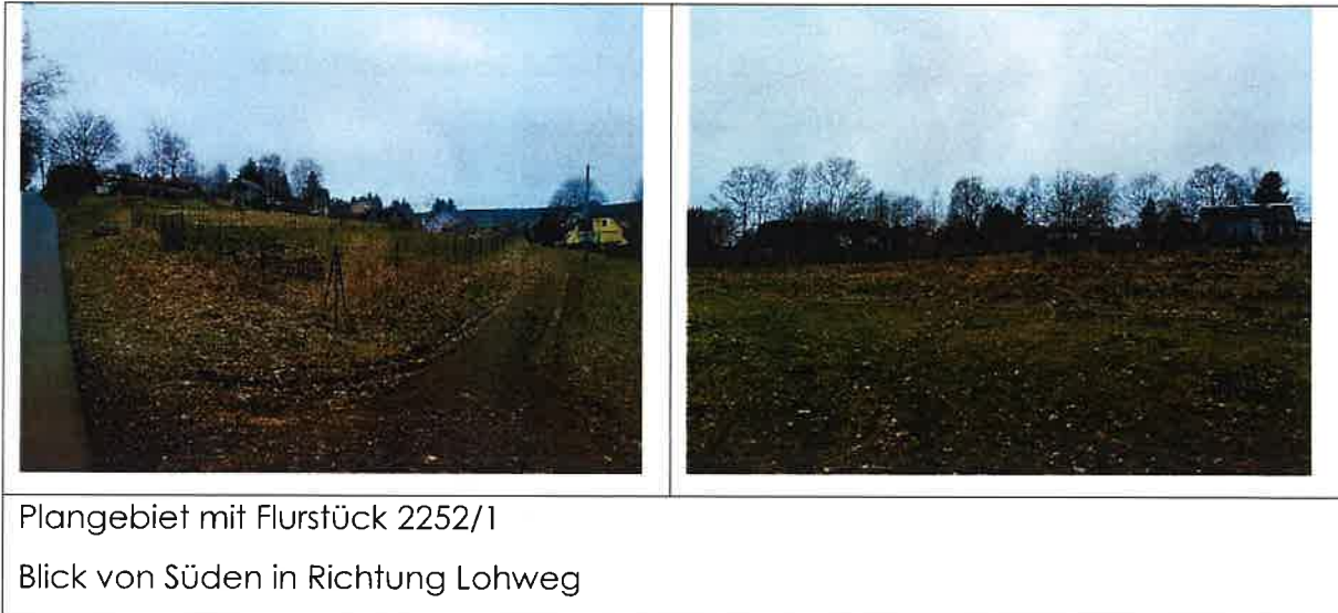
Abbildung 4 Geltungsbereich Wohngebiet "An den Korbweiden".